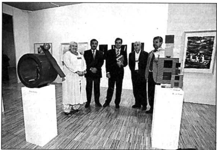
'Stand' de Guaita con las autoridades locales.

Quasars y Guaita son las galerías mallorquinas que han apostado por ArtSantander y sus propuestas