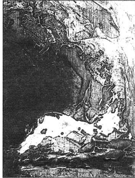
Grabado de Riera Ferrari.