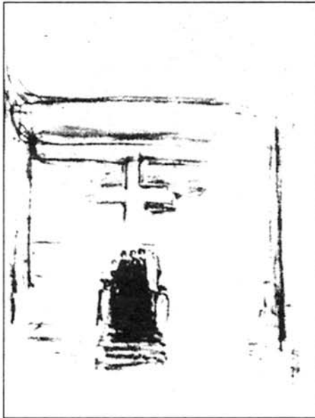
Serigrafía de Utzon.