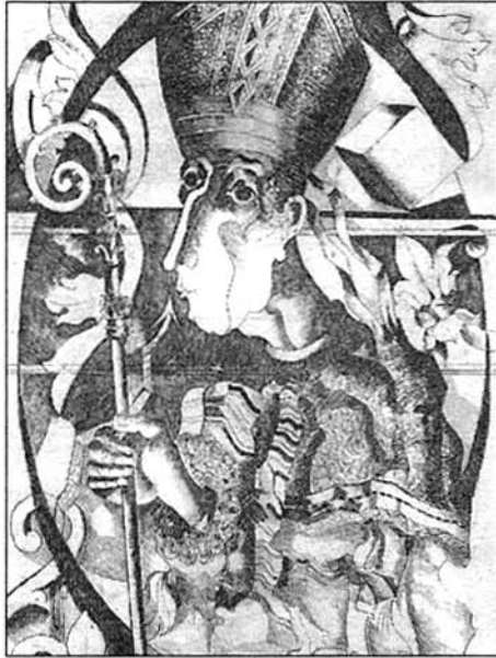
Grabado de Pere Quetglas «Xam».